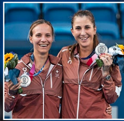
Freudentränen! Gold erkämpfte sich Belinda Bencic (l.) im Tennis-Einzel, Silber im Doppel mit Viktorija Golubic (o. l.).

Mitfiebern und mitjubeln! Unsere Olympiathletinnen und -Athleten sorgten in Tokio bereits in der ersten Woche für unvergessliche Momente mit Triumphen und Rekorden – und der Krönung mit Gold, Silber und Bronze.