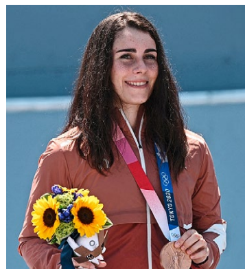
Verewigt! Nikita Ducarroz hat es im BMX-Freestyle zu Bronze gereicht.