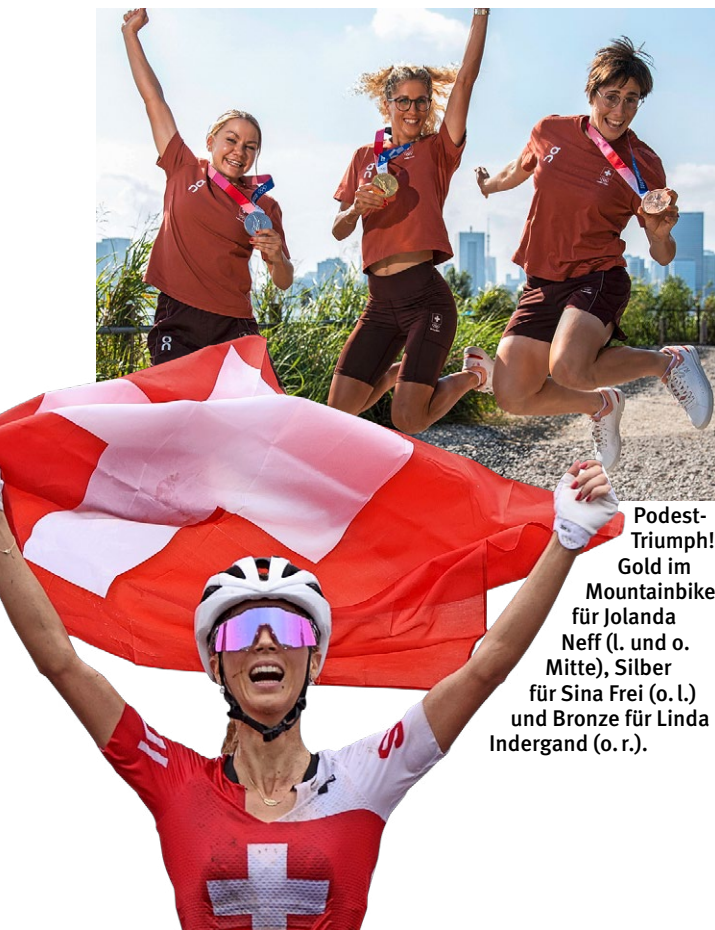
Podest-Triumph! Gold im Mountainbike für Jolanda Neff (l. und o. Mitte), Silber für Sina Frei (o. l.) und Bronze für Linda Indergand (o. r.).