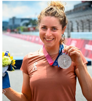
Bravo! Marlen Reusser schaffte die Silber-Medaille im Rad-Zeitfahren.